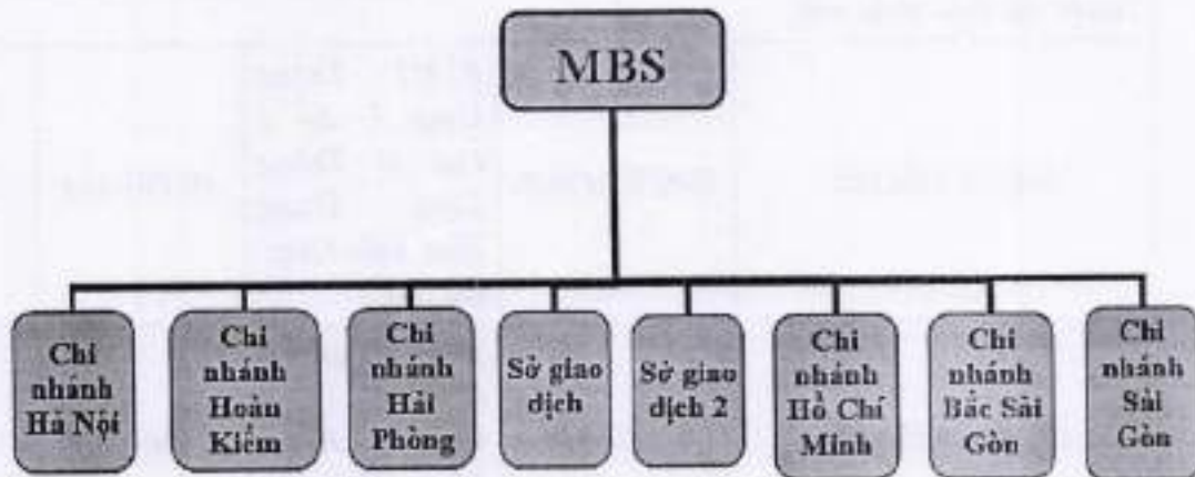
Hình 4: Mạng lưới của công ty.